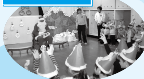
■H28年12月22日 市長サンタ 文殊こども園