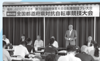
■H29年8月23日 自転車競技 (国体プレ大会)監督会議