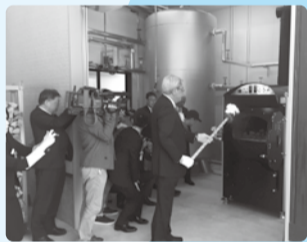
■H29年4月2日 伊自良館木質 バイオマスボイラー火入れ式