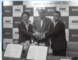
■H29年8月28日 あいおいニッセイ同和損保との 地方創生に関する連携協定締結式