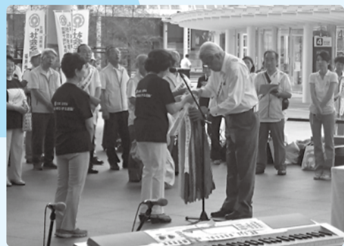
■H29年7月1日 社会を明るくする運動 街頭キャンペーン