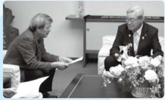
■H29年2月7日 新幹線福井駅舎 デザインコンセプト市長報告