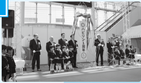
■H29年4月28日 ハピリン1周年記念セレモニー