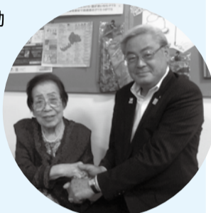
■H29年9月5日 百歳慶祝訪問