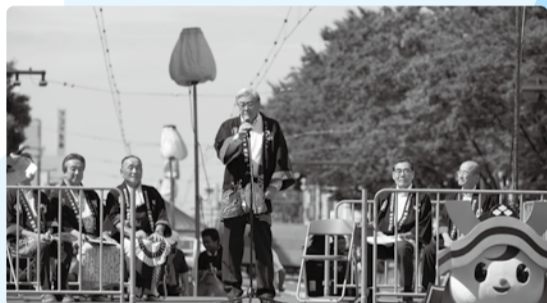
■H29年8月5日 福井フェニックスまつり(YOSAKOIイッチョライ)