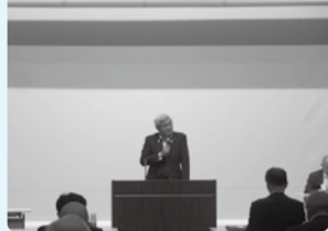
■H29年5月25日 新幹線建設促進協議会