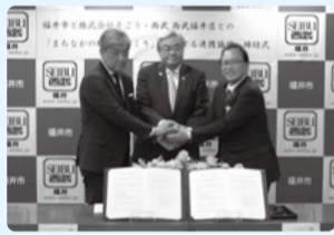
■H29年2月22日 そごう西武・西武福井店との まちなか賑わいに関する 連携協定締結式