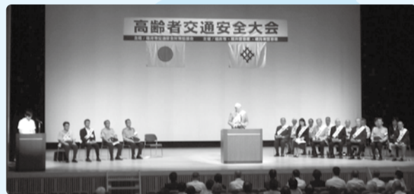
■H29年8月24日 高齢者交通安全大会