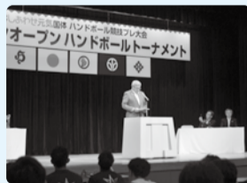
■H29年8月4日 ハンドボール競技 (国体プレ大会)開会式