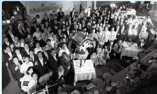
■H29年6月28日 福井市応援隊ミーティング