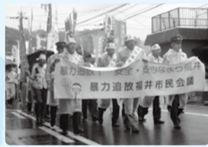
■H29年7月4日 暴力追放福井市民会議決起大会