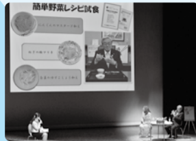
■H29年2月19日 ベジ大使 トークショー