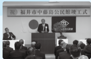
■H29年4月9日 中藤島公民館竣工式