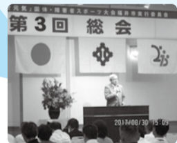
■H29年8月30日 福井市実行委員会 第3回総会