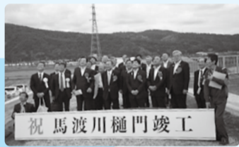
■H29年6月3日 馬渡川樋門竣工式