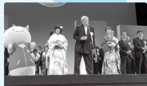
■H29年1月8日 福井市成人式 成人のつどい