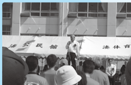
■H29年5月21日 湊地区区民体育大会開会式