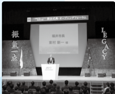
■H29年5月27日 全国城下町シンポジウム開会式