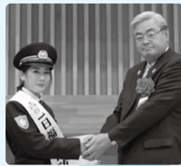
■H29年2月19日 防犯協議会冬季 練成大会