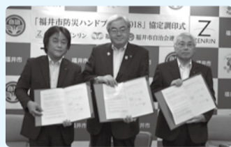
■H29年5月31日 防災ハンドブック 協定調印式