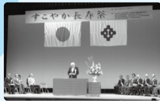
■H29年5月25日 すこやか長寿祭