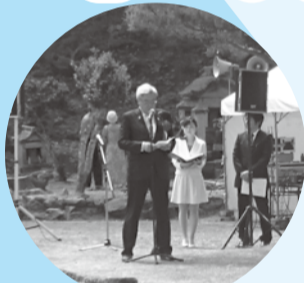
■H29年5月5日 朝倉曲水の宴