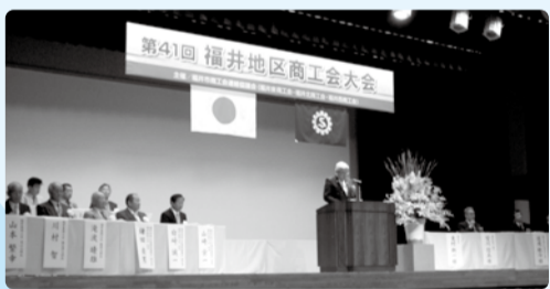
■H28年6月26日 福井地区商工会大会