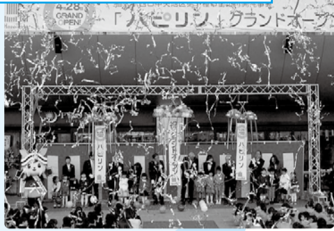
■H28年4月28日 ハピリングランドオープン