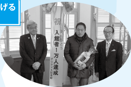
■H28年3月4日 グライフイス記念館 来場者1万人達成 記念セレモニー