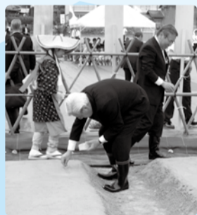
■H28年6月4日 新嘗祭供御献穀粟播種式