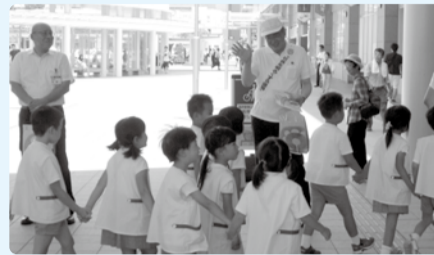
■H28年8月21日 土砂災害防災訓練