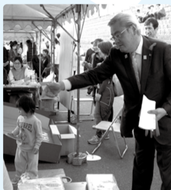
■H28年4月9日 越前湊さくら祭り 開会セレモニー