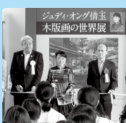
■H28年9月17日 美術館企画展 「ジュディ・オング 倩玉 木版画の世界展」 開場式