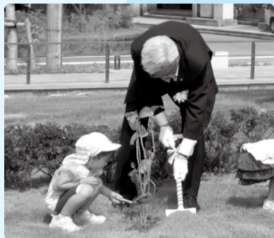
■H28年7月28日 福井市中央公園第1期整備エリア オープニングイベント