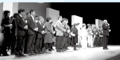
■H28年1月10日 福井市成人式