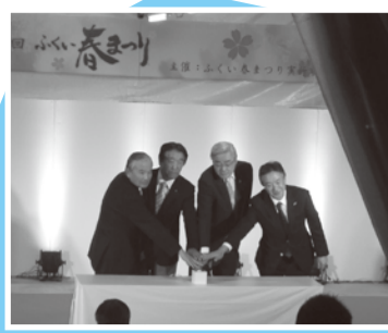
■H25年4月1日 春まつりオープニング