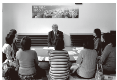
■H24年12月6日 特定非営利活動法人 福井県子どもNPOセンター