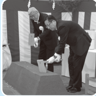
■H25年9月28日 西口再開発事業新築工事起工式