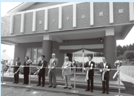
■H25年8月10日 宮ノ下公民館竣工式テープカット