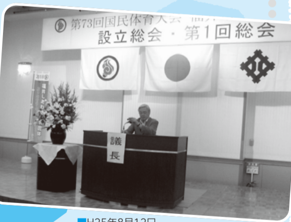
■H25年8月12日 国体福井市準備委員会設立総会