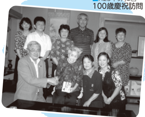
■H25年9月2日 100歳慶祝訪問