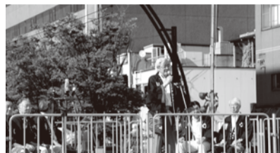
■H25年8月3日 第60回福井フェニックスまつり 民謡・YOSAKOIイッチョライ