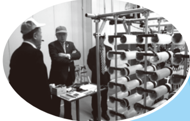
■H25年3月21日 先進的取組み企業訪問