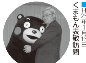
■H25年1月15日 くまもん表敬訪問