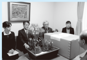
■H24年12月27日 越前水仙を常陸宮家へ献上