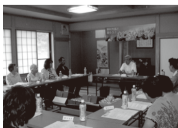
■H25年7月20日 米工房 ほ・た・る

子どもたちにとっては、経験をたくさん積み環境を作ることが大切だと思います。また、親と子がしっかり向き合えるように地域ではNPOが手助けし、官としては学校教育と連携して活動を支援することが重要になってくると思います。