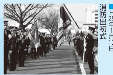
■H25年1月12日 消防出初式