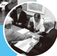
■H25年8月8日 国土交通省要望活動