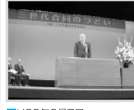
■H22年2月7日 三世代合同のつどい