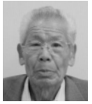
越廬地区 村中 勝士

一乗地区は朝倉氏遺跡を中心とした福井市を代表する観光地であり、昨年は天皇皇后両陛下をお迎えして、全国植樹祭が開催されました。植樹された樹は敷地内へ定植され、元気に育ち、多くの皆さんに親しまれています。市長の「希望と安心の福井新ビジョン」にありまるとおり、朝倉氏遺跡を福井市の観光拠点として、整備を進めて下さい。