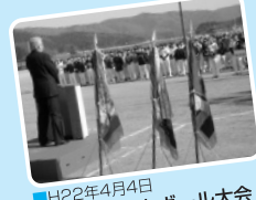
■H22年4月4日 福井市民ソフトボール大会 開会式