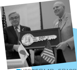
■H22年5月14日～5月18日 プラトーン市(カリフォルニア州) 姉妹都市提携20周年記念事業