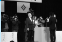
■H22年1月10日 平成22年福井市成人式