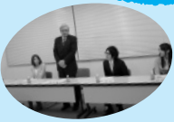
■H22年1月28日 新成人わくわくトーク