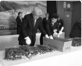
■H22年3月17日 駐日タイ王国大使との面談