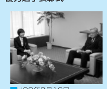
■H22年3月16日 青年海外協力隊隊員激励会