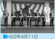
■H22年4月11日 清水東公民館 竣工式