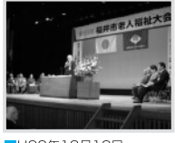
■H22年10月13日 福井市老人福祉大会