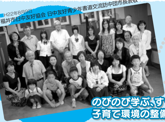
■H22年8月9日 福井市日中友好協会 日中友好青少年書道交流訪中団市長表敬