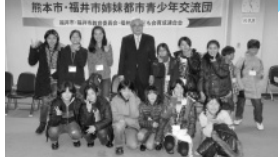
■H22年1月8日 第15回福井市・熊本市姉妹都市 青少年交流事業歓迎式