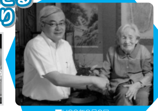
■H22年9月2日 100歳慶祝訪問