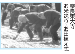
■H22年5月8日 奈良東大寺 お米送りお田植入式