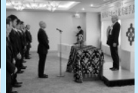
■H22年2月9日 平成21年福井市スポーツ 優秀選手表彰式