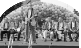
■H22年7月30日～8月1日 第57回福井フェニクスまつり